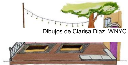
Dibujos de Clarisa Diaz, WNYC.

Fill containers to the top with clean soil.