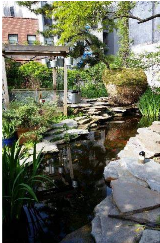
Estanque en La Plaza Cultural rodeado por una barrera de pizarra