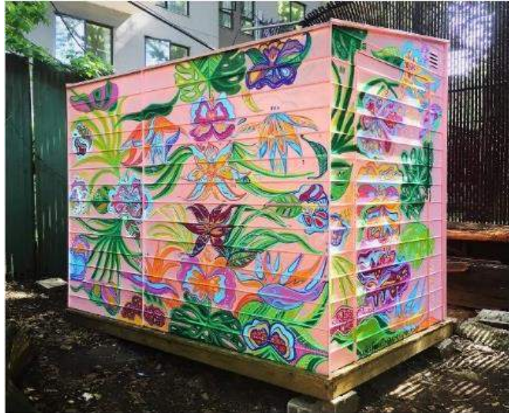
Mural de Meg Minkley, titulado Fiesta Forever , en un cobertizo de Powers Street Garden en Brooklyn | Fotografía del artista Meg Minkley.

GreenThumb busca cultivar relaciones colaborativas y sociedades entre artistas locales y jardineros comunitarios para la creación de una amplia variedad de obras de arte. Todos los murales, esculturas, presentaciones y actividades relacionadas con el arte experimental, la música y la poesía pueden llevarse a cabo en los jardines comunitarios, y esperamos ser el vínculo que los conecte.