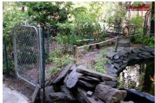
Estanques con características de seguridad adecuadas en el jardín comunitario Green Oasis de Manhattan