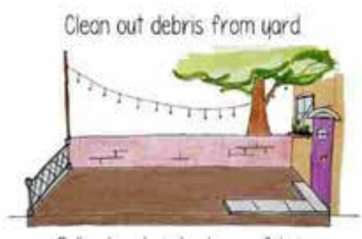
그림 제공: Clarisa Diaz, WNYC