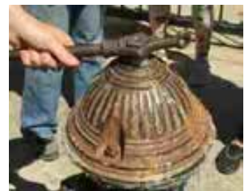
사진 및 스크린샷 출처: 6BC Botanical Garden 의 설명 동영상. 허가 후 사용함. 웹사이트에서 더 알아보기: 6bcgarden.org/how-to-water-the-garden