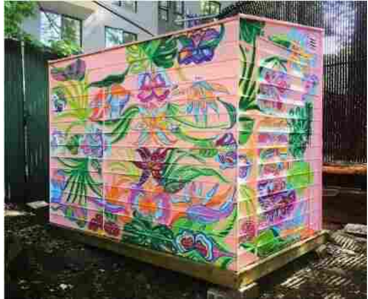
브루클린 Power Street Garden 창고 건물 벽화. 작가: Meg Minkley 제목: "Fiesta Forever"

GreenThumb 은 지역 예술가와 커뮤니티 가드너의 협업 관계와 파트너십을 함양하여 광범위한 예술 작품을 만들어내고자 합니다. 벽화, 조각, 퍼포먼스, 실험적 예술, 음악, 시 모두가 커뮤니티 가든에 함께할 수 있으며, GreenThumb 은 이들을 한데 묶는 가교 역할을 하고자 합니다.