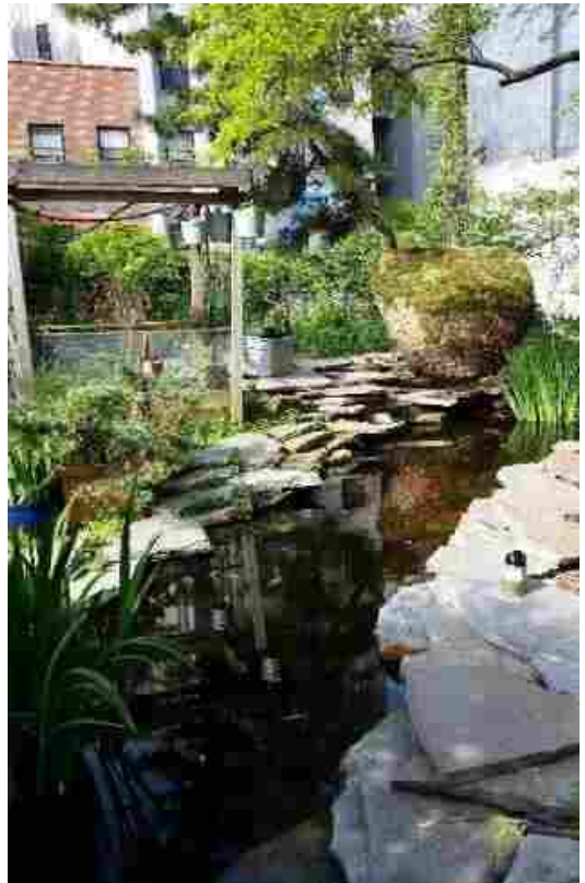
점관암으로 둘러싸인 La Plaza Cultural 의 연못