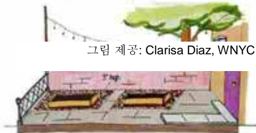
그림 제공: Clarisa Diaz, WNYC