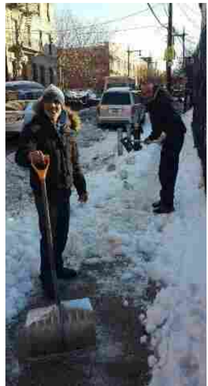
Jardin de la Roca 에서 제설 중인 모습