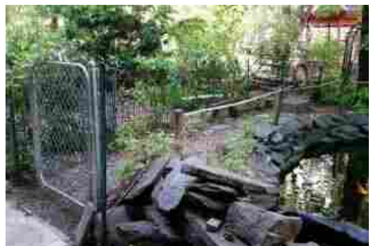
적절한 안전장치가 있는 맨해튼 Green Oasis Community Garden 의 연못