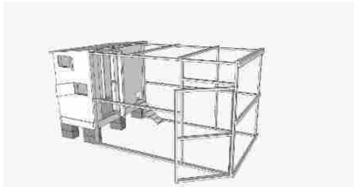
Just Food City Chicken Guide의 닭장 디자인 샘플. 벽으로 둘러싸인 공간이 닭장이며, 철망이나 철조망으로 벽을 친 열린 공간은 방목장입니다.